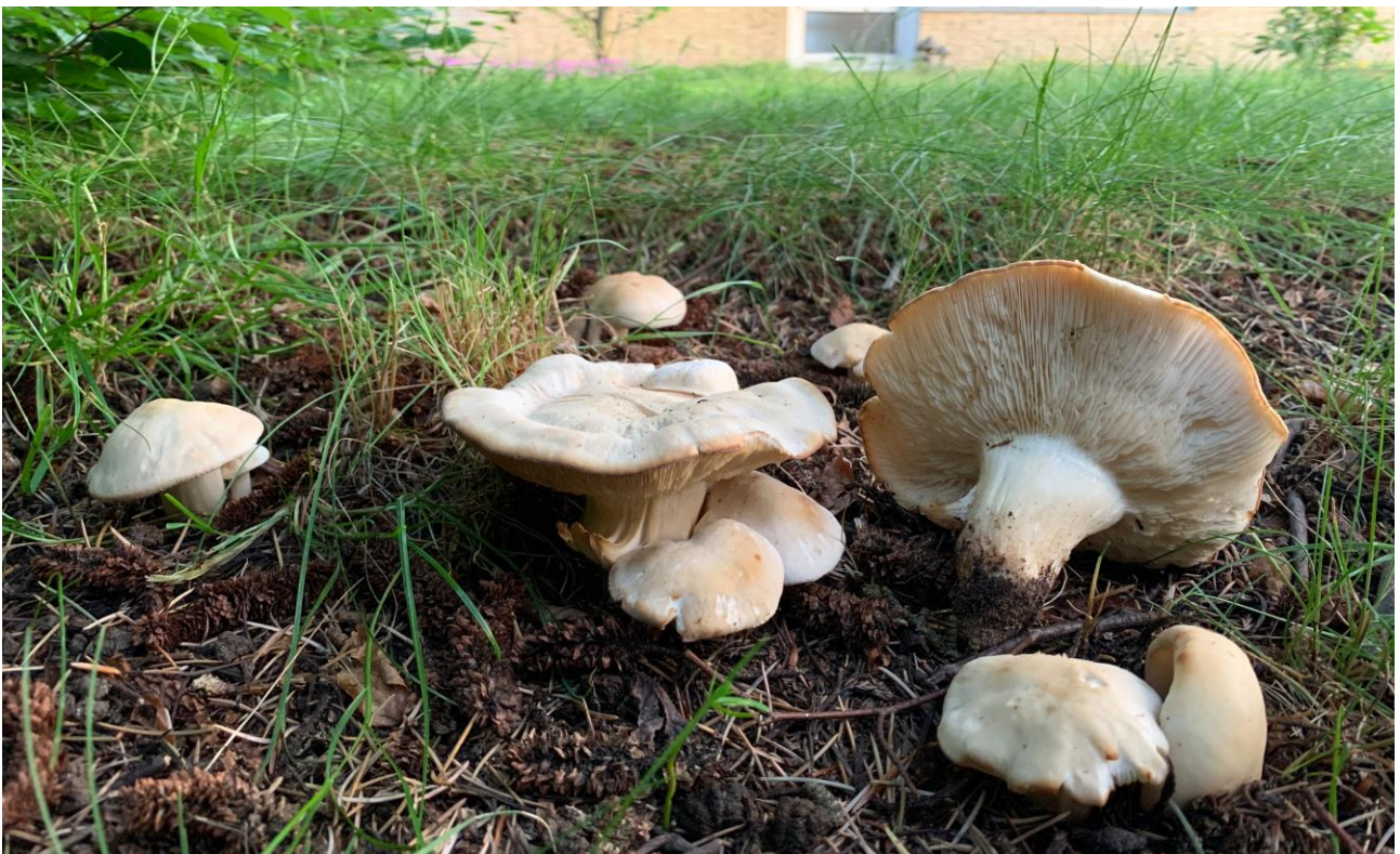
Vårmusseronerne var få og sene i år. Formandens trofaste mycelium i forhaven sendte frugtlegemer op henimod midten af juni, trods manglen på nedbør i Hillerød, men morklerne måtte de fleste kigge langt efter.