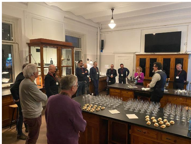
MycologyDK Network-møde på Carlsberg Laboratorierne, 9. januar 2023.