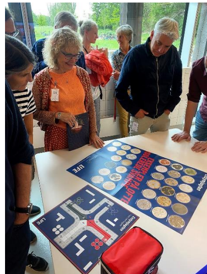
MycologyDK Network-møde på Novozymes, 24. maj 2023.

Netværket har udtrykt ønske om at organisere en Svampefestival i weekenden 5.-6. oktober 2024 med deltagelse af Svampeforeningen. Muligvis kan vi låne lokaler på Holmen i København til arrangementet, og adskillige virksomheder/institutioner har vist interesse i at deltage. Planlægningen er endnu på et meget indledende stadium, men målet er et arrangement i stil med foreningens 100-års jubilæums-svampefestival i 2005 med svampeudstilling – blot i langt mindre omfang. Formanden deltager i planlægningsmøderne, evt. sekunderet af en repræsentant for Lokalfdelingen Sjælland.