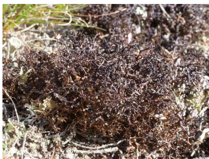
Finger-Kvistlav ( Hypogymnia tubulosa ), Rød Bægerlav ( Cladonia diversa ) og Tue-Tjørnelav ( Cetraria muricata ), tre almindelige laver på Melby Overdrev.