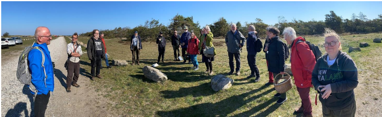
Lavgruppen på Melby Overdrev.