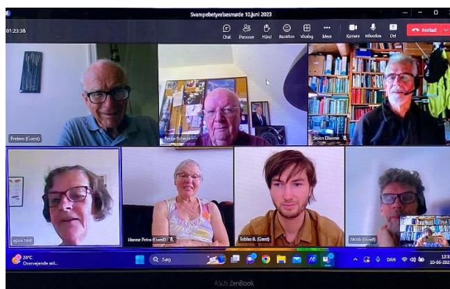
Fra bestyrelsesmødet den 10. juni 2023.

Herudover var der på daværende tidspunkt overført støtte til Lokalfdelingerne i Østjylland og på Lolland-Falster, og til Lavgruppen.