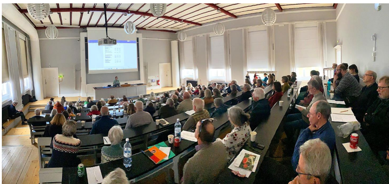
Svampedagen i Geologisk Museums foredragssal i 2023.