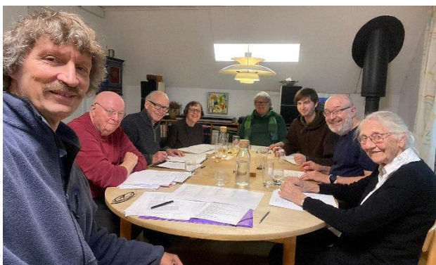
Fra bestyrelsesmødet den 4. november 2023.

Sammenlagt endte 2023 med et pænt overskud, der dog ikke helt kan opveje underskuddet i 2022. Foreningens regnskab bliver fremlagt ved generalforsamlingen på Svampedagen.