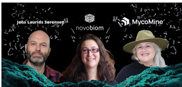
MycologyDK Network-møde på DTU, 15. december 2023, og vinderne af 'The Future is Fungi Award'.