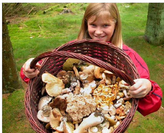
Stor svampekurv og lille pige i Pedersker Plantage, Bornholm.