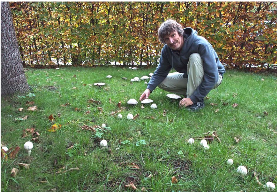
Sen svampehøst: masser af Karbol-Champignon skyder op i formandens have, 8. november 2014. De er uskællede som unge, men kraftigt skællede ved modenhed. Har kun en svag duft af blæk og er svagt gulnende ved berøring, bliver skriggule under opvarmning og får en forunderlig klistret konsistens ved tilberedning og metallisk smag, så der er ikke noget at tage fejl af. Indeholder bl.a. nogle fenol-lignende forbindelser, som kan give voldsomme mavetilfælde.