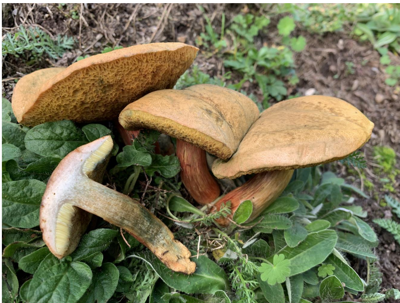
Aurora-Rørhat (Hortiboletus bubalinus) under lind og buksbom i Barokhaven ved Frederiksborg Slot. En af vores over 70 rørhattearter i Danmark, som nu let kan bestemmes med 'Nordeuropas svampe'. 12. september 2019.

En bog med nye nøgler til basidiesvampe ventes at udkomme henover vinteren som et resultat af Atlasprojektet. Bogen bliver på omkring 500 sider i B5-format, og den skal også indeholde nøgler til rust, brand og "bøllesyge"-svampe. Arbejdet med bogen er i gang, og sammen med det store, illustrerede bogværk 'Nordeuropas svampe' vil den få en helt central betydning for mange medlemmers svampebestemmelser i årene fremover.