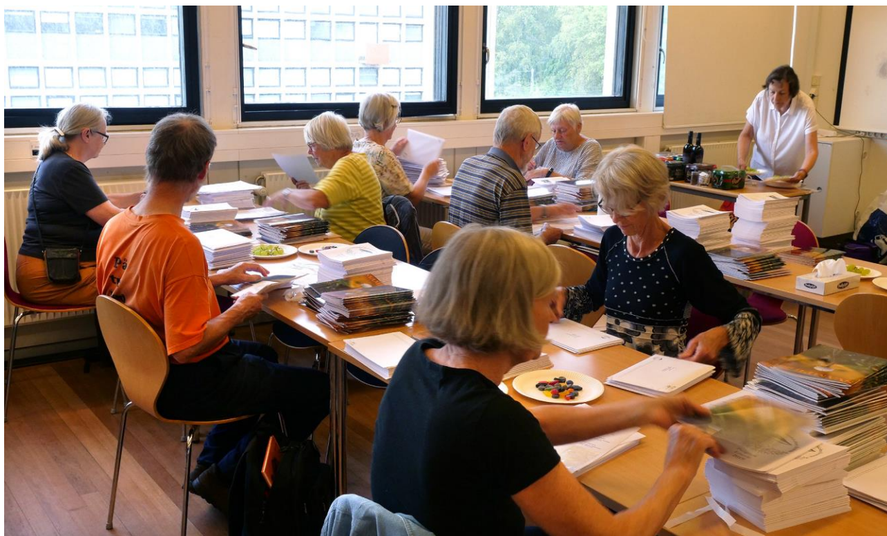
Pakning, adressering og fordeling i 40 PostDanmark-bakker af 2000 tidsskrifter og programmer klares på et par timer ved fælles hjælp. Her arbejder 9 medlemmer sig målrettet gennem de mange kasser med kuverter og blade for at nå frem til den efterfølgende bespisning. Foto: F. Rune, 6. august 2019.

Svampe 80 og foreningens program for efteråret 2019 (hhv. 48 og 64 sider) blev pakket og adresseret i ca. 2.000 kuverter af 20-25 friske medlemmer ved Lokalafdelingen Sjællands sendemøde tirsdag den 6. august 2019 på H.C.Ørsted Institutet i København. Lokalafdelingen takkes for veludført arbejde!