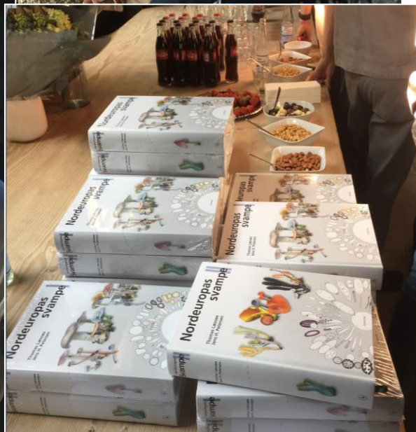
Udgivelsesreceptionen for 'Nordeuropas svampe' hos Gyldendal i Klareboderne, København. Foto: F. Rune, 21. august 2019